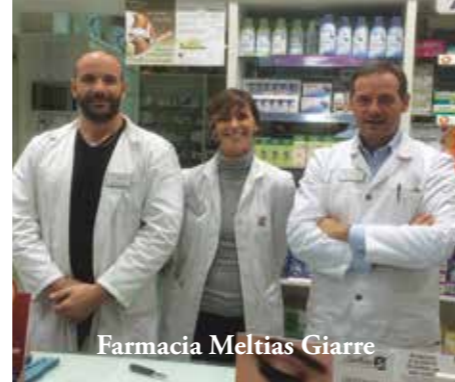
Farmacia Meltias Giarre