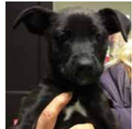
FUTURA Femmina 3 mesi taglia media