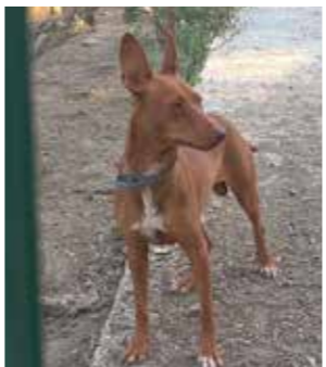
GIULIO cirneco vivace 12/13 kg circa un anno