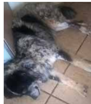
KNUT femmina 4/5 anni buonissima. Nata cieca ora è rimasta sola. Non c'è più suo padrone. Abituata in casa.

I cani non hanno che un difetto: credono agli uomini. (Elian J. Finbert)