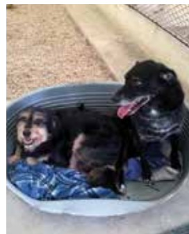
CASTAGNA E LIQUIRIZIA inseparabili, cercano carezze e un giardino. Buonissimi con animali e persone