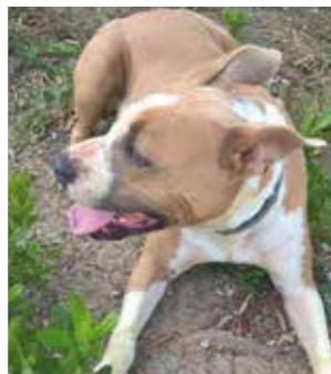
PIPA Amstaff femmina sterilizzata. Va d'accordo con maschi giocherellona circa un anno e mezzo