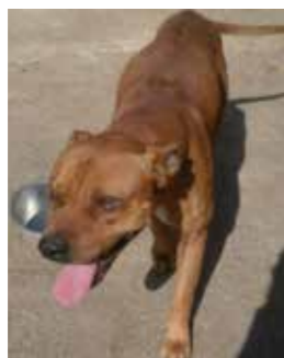
YOGHI ADOZIONE DEL CUORE. Giocherellone operato schiena. Commina scoordinato. Buonissimo con tutti. Ha bisogno presenza umana.