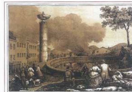
I bagni di Abano, litografia tratta da: «Il territorio padovano illustrato per Andrea Gloria». P. Prosperini, Padova, 1862.

"Sarebbe, è vero, desiderabile che la musica esilarasse più di frequente gli animi; che un gabinetto di lettura in ognuno dei tre gruppi di stabilimenti concorresse a ricreare le menti annebbiate dai vapori e dalle sofferenze; che asinelli e veicoli fossero pronti ovunque a dar moto alle membra deboli e irrigidite".