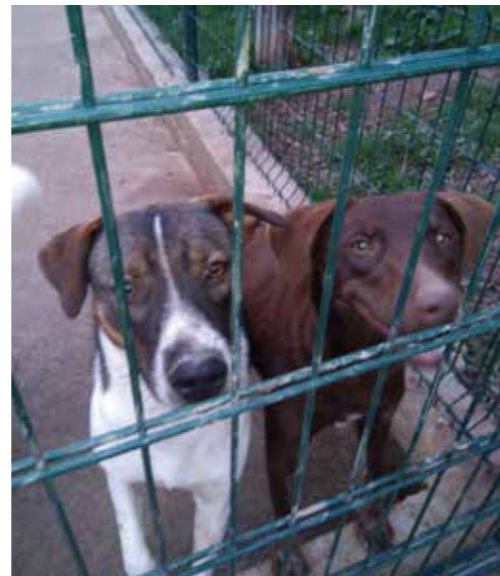
Cioccolata 8mesi sterilizzata e il fratello Cappuccino . Circa 15/16 kg . Buonissimi un po' timidi