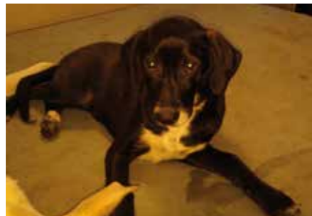
Chanel splendida 5 mesi. Simil poenter, cerca casa e se con la sorella sarebbe proprio un miracolo