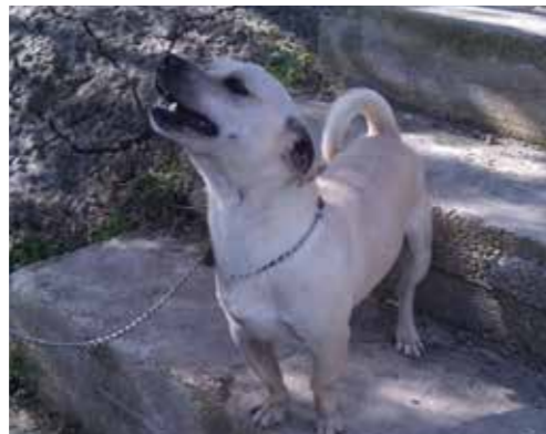
Jek. Molto vivace. Castrato, circa 1 anno e mezzo. 7/8 kg . Cerca casa, non può vivere legato