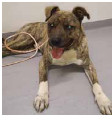
Tor. Stupendo Pitt ,castrato Max 1 anno. Vivace,giocherellone. Circa 30kg