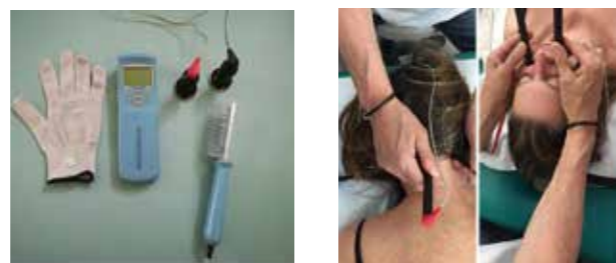
Foto 4 e 5: alcuni strumenti di lavoro della Terapia Scenar: guanti, pettine, funghi e sul paziente i Combi

Gli innumerevoli protocolli della Terapia Scenar integrano il trattamento sulle tensioni muscolari presenti nella masticazione e sui muscoli del collo.